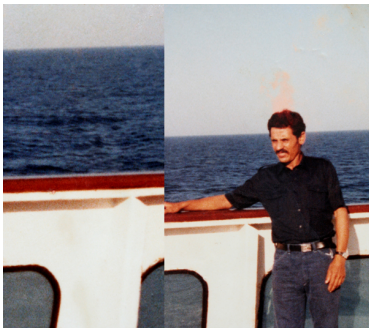
Miramas \ Bouches du Rhône Saint-Denis-Montreuil-Les Lilas \ Seine St Denis \ France