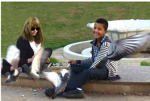
Rabat \ Maroc