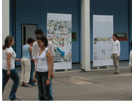
Alger \ Algérie