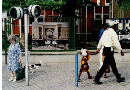
Bobigny/ Seine St Denis \France

Cette série est le résultat d'une carte blanche confiée par la ville de Bobigny à Catherine Poncin. Bobigny est une ville d'accueil multiculturelle. Son extension a été précipitée à partir des années 1960. Comment transmettre l'histoire de ce territoire aux nouvelles populations qui l'habitent ? Face à cette nécessité, l'artiste y répond en allant explorer dans le fonds d'archives photographique du journal municipal des images, à partir desquelles elle reconstruit par strates la mémoire de la ville. Afin que les habitants découvrent les œuvres photographiques réalisées, des tirages sont fabriqués sur bâches plastiques puis exposés dans l'espace public : accrochées à l'entrée du conservatoire de musique, dans le parc municipal, sur des axes et carrefours routiers... Des visites ont été commentées par l'artiste sur les différents sites lors des déambulations-