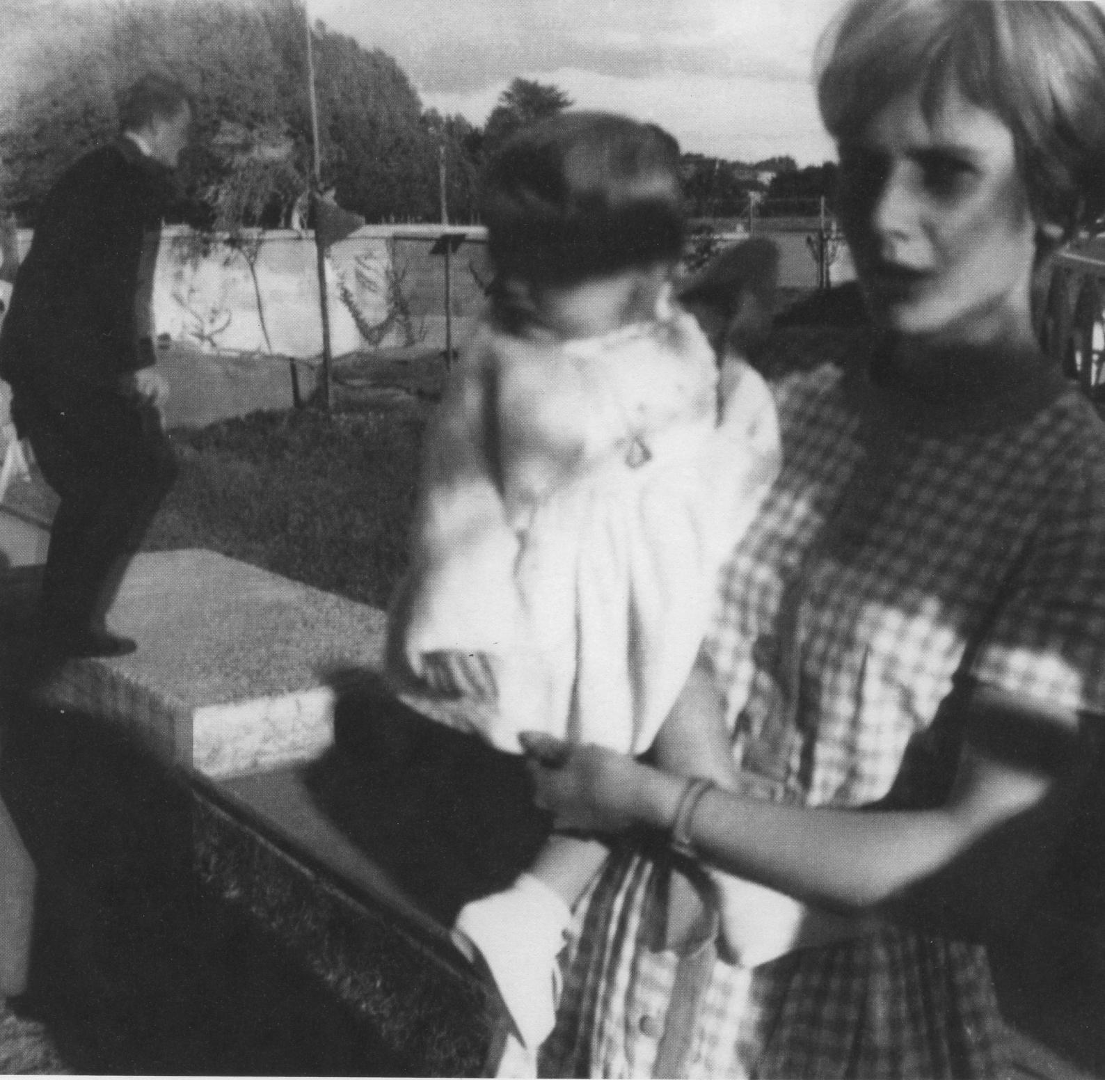
LE JOUR D'AVANT , 2020 d'après une photographie anonyme © Catherine Poncin, Galerie Les Filles du Calvaire – Art Culture & Co