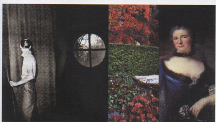
Série Palimpseste , 2002 Commande de l'Auberge de l'Europe Château Fervey Voltaire