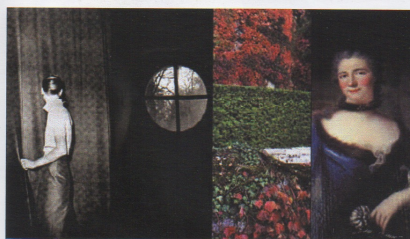
Série Palimpseste , 2002 Commande de l'Auberge de l'Europe Château Ferney Voltaire