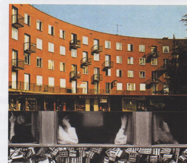
Série Du champ des hommes, territoires , 2001 Commande de la Ville de Bobigny

Les Editions Filigranes . 7 ans... C'est en 1999, que Filigranes Éditions et la galerie Les filles du calvaire ont débuté une collaboration étroite en publiant, ensemble, 22 ouvrages. Ainsi pour le Mois de la Photo à Paris, nous souhaitons mettre en avant cette singulière collaboration en organisant une exposition de l'ensemble de ces livres. L'idée est d'aménager un lieu de lecture qui se présente comme un salon-bibliothèque dans la galerie. Parallèlement, un écran vidéo diffuse, en boucle, des entretiens avec ces 10 artistes de la galerie, où chacun aborde sa problématique et l'intérêt de voir son travail imprimé dans les pages d'un livre.